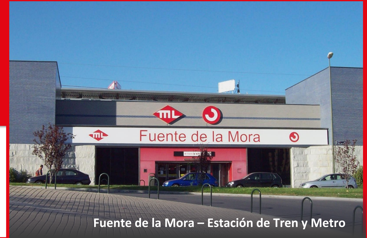
Fuente de la Mora – Estación de Tren y Metro