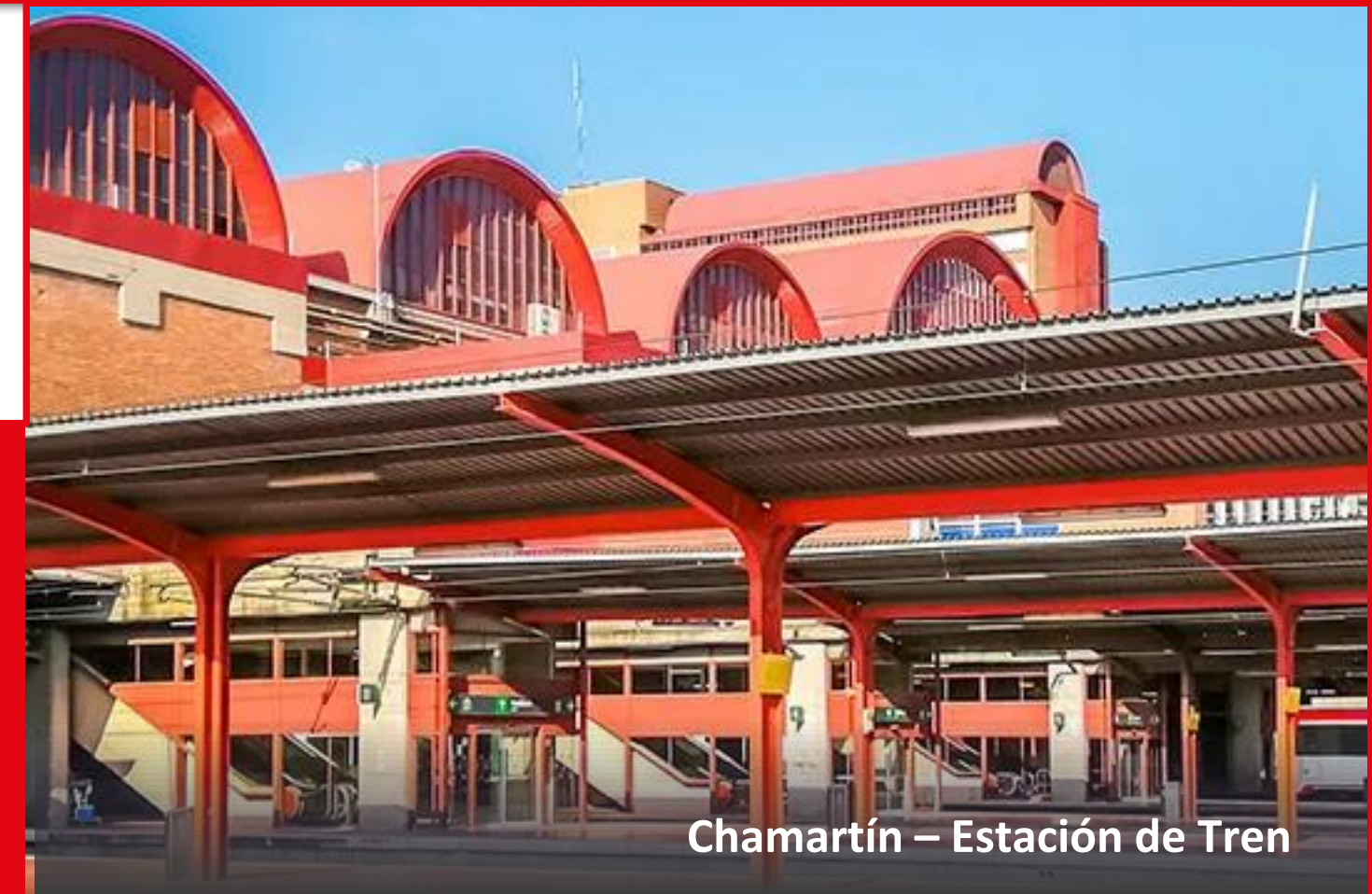
Chamartín – Estación de Tren