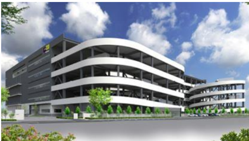
大阪府高槻市芝生町1-52-2